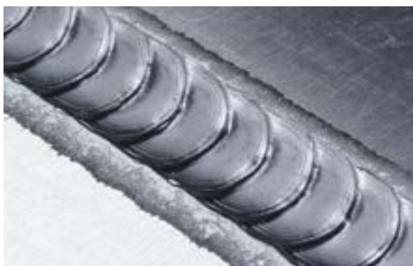
Preplátovaný zvar 3 mm, hliník Vd: 7,7 m/min Vs: 50 cm/min

Prídavný drôt: CuSi3 1 mm Počet cyklov CMT: 8