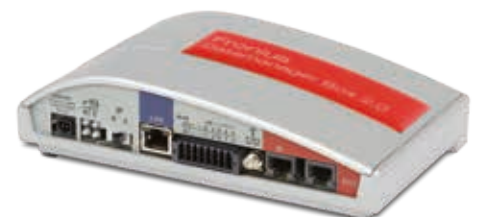
/ Fronius Datamanager Box 2.0